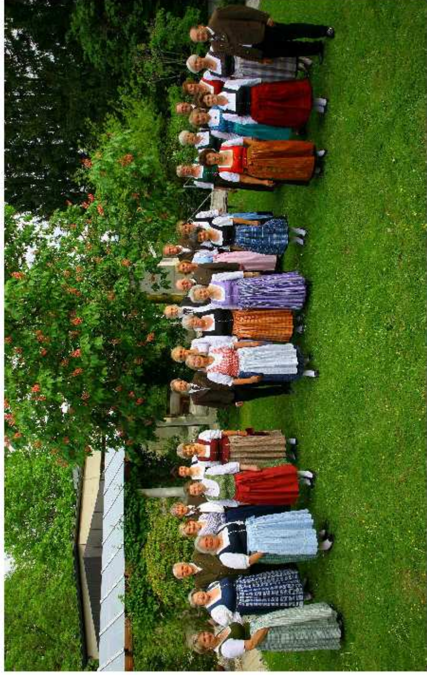
Singvereinigung Miesbach – Chorbild